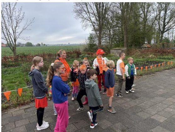
Uitleg Oud-Hollandse spellen