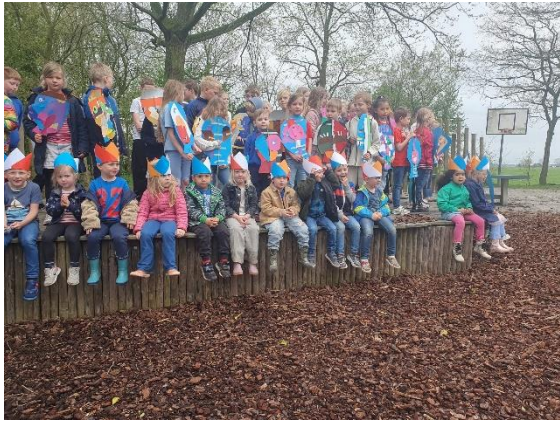
Optreden 'Vrij' voor project 80 jaar vrede en vrijheid