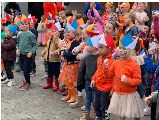
Dansen: Baila, bailala!