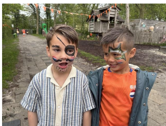
Geschminckt! ^ Apenkooi in Artharpe v