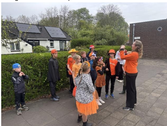
Waar liggen alle eieren verstopt? Zoeken maar!