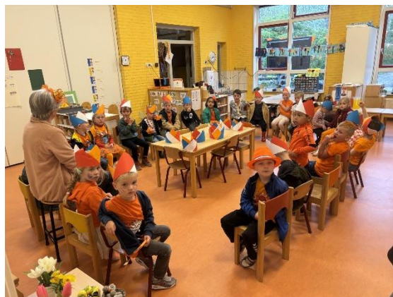
Uitleg kleine plein ^ Hoepeldans/ eierloop v

Gezocht, gezocht! Het 4 en 5 mei comité van Adorp, Sauwerd, Wetsinge zoekt nog iemand die in de voorbereiding op de herdenking op 4 mei mee wil draaien. Dit betekent 1 bijeenkomst van 2 uur, waarin de zaken worden geregeld. Het is belangrijk dat dit goed georganiseerd wordt. Mocht je hiervoor belangstelling hebben, dan horen we het graag. Je kunt je dan rechtstreeks melden bij Elske Dijkstra 0650257681 of bij ondergetekende.