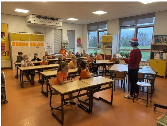
Uitleg Koningsspelen groep 4/5